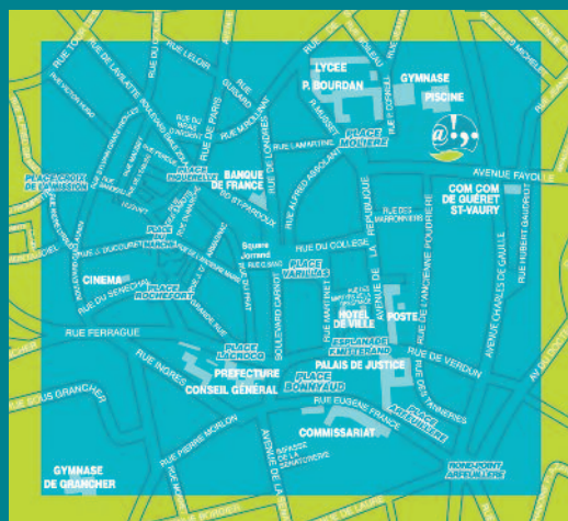
Plan d'accès - Parking gratuit.

Bibliothèque Multimédia Intercommunale 8 Avenue Fayolle - 23000 GUERET E-mail : contact@bmi-gueret.fr